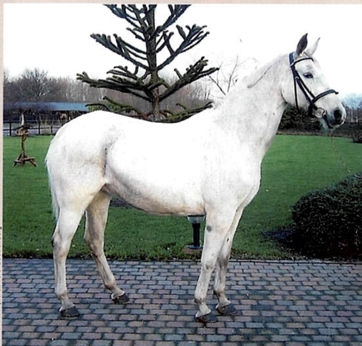
Archief Monique Lamers-Couwenberg

De G.Ramiro Z-dochter Citty heeft zichzelf dubbel en dwars bewezen in de fokkerij. Ze bracht hengstenkeuringskampioen Littus R en reeds vier internationale springpaarden.