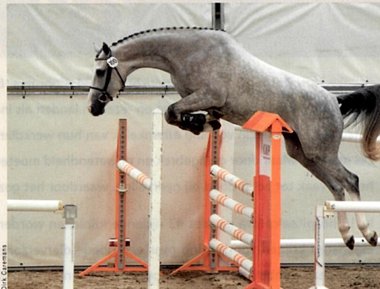
Citty's kleindochter Ditty Dante C (Vingino x Lupicor) schitterde afgelopen jaar op de NMK. Zij wordt nu eerst ingezet voor de fokkerij en zal daarna in de sport worden uitgebracht.